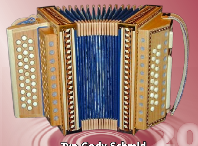
Typ Gody Schmid 2- oder 3-chörig (Balg Blau) sehr geringer Luftverbrauch