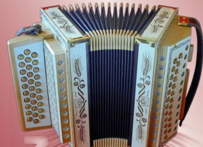
Typ 95 K - G Handgeschnitzte Aehren in Ahornholz 2- oder 3-chörig