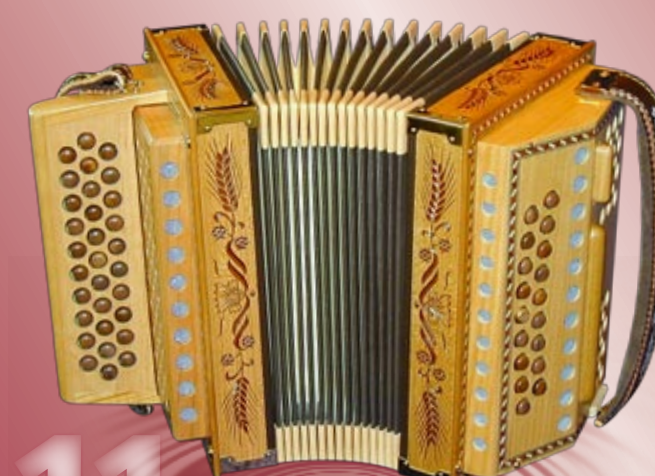
Typ 87 K - G Handgeschnitzte Aehren in Kirschbaumholz 2- oder 3-chörig