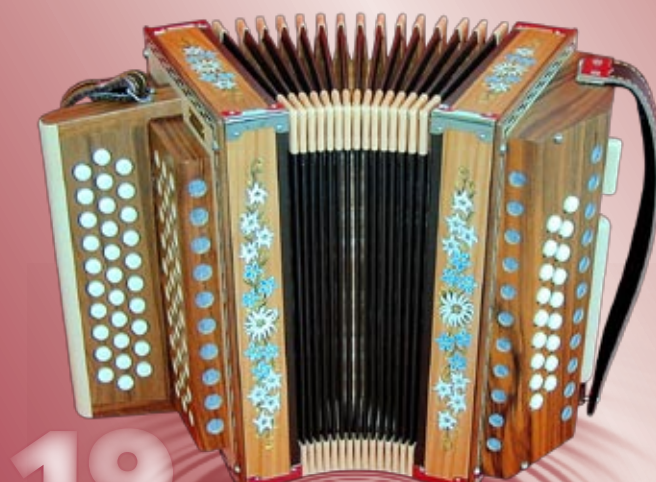
Typ 80 N - B Bauernmalerei 2- oder 3-chörig