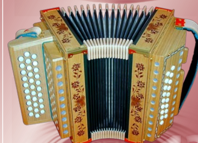
Typ 87 K - G Handgeschnitzte Edelweiss / Enzian in Kirschbaumholz 2- oder 3-chörig