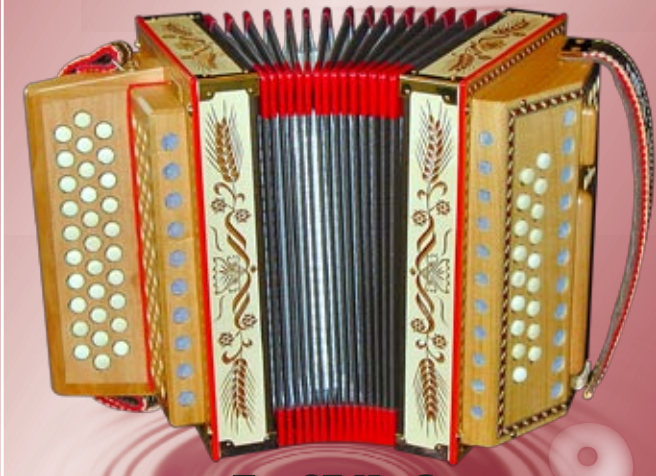
Typ 87 K - G Handgeschnitzte Aehren in Ahornholz 2- oder 3-chörig