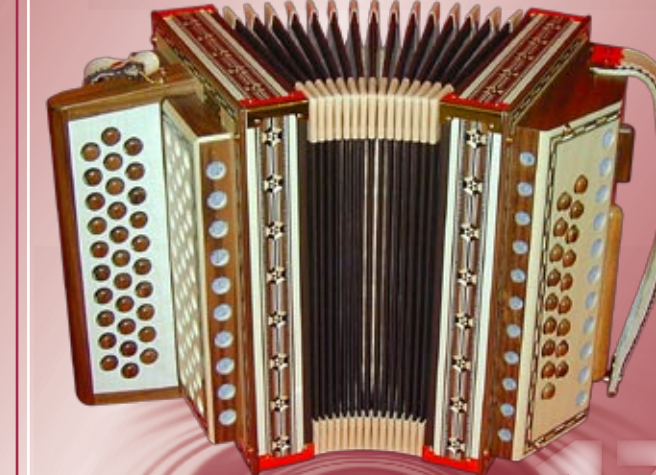
Typ 91 A - WZ 2- oder 3-chörig