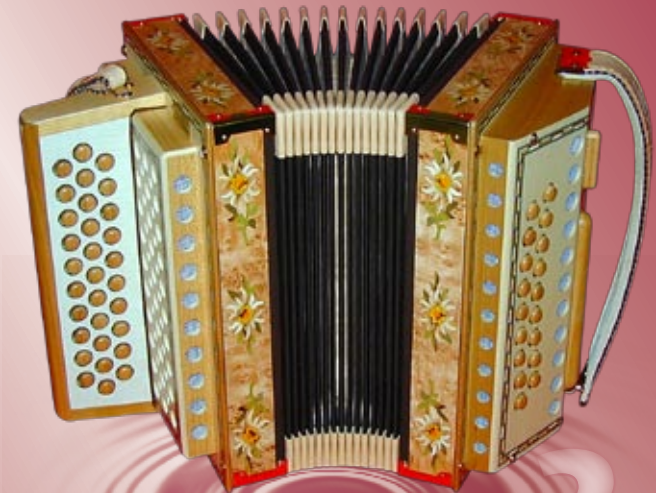
Typ 95 K - EMKM 2- oder 3-chörig