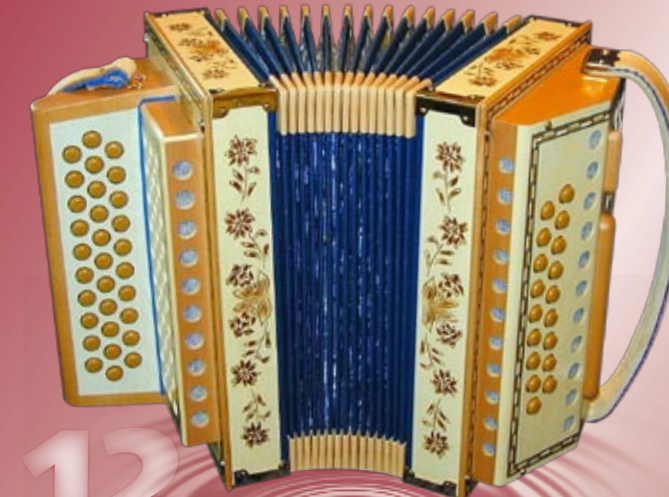
Typ 95 K - G Handgeschnitzte Edelweiss / Enzian in Ahornholz 2- oder 3-chörig