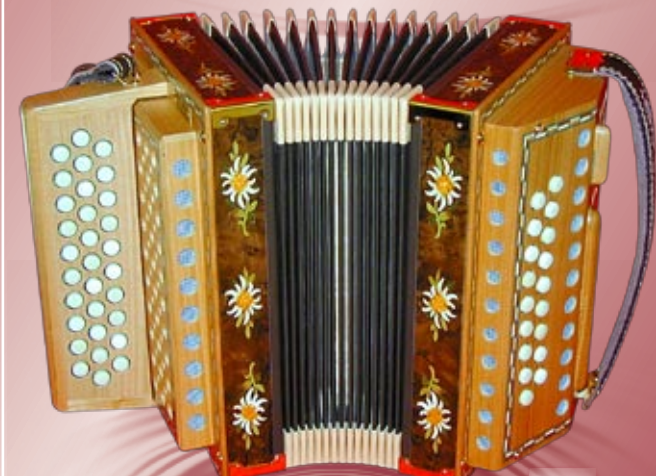
Typ 87 K - EMNM 2- oder 3-chörig