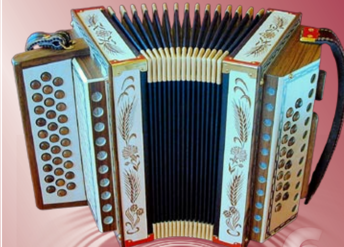
Typ 91 A - G Handgeschnitzte Aehren in Ahornholz 2- oder 3-chörig