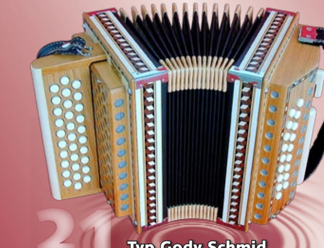
Typ Gody Schmid 2- oder 3-chörig sehr geringer Luftverbrauch