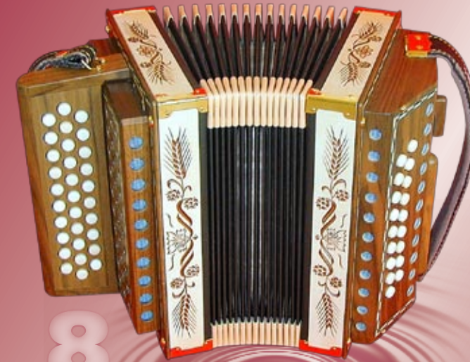
Typ 88 N - G Handgeschnitzte Aehren in Ahornholz 2- oder 3-chörig