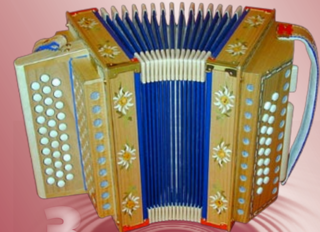
Typ 85 K - EMKN 2- oder 3-chörig