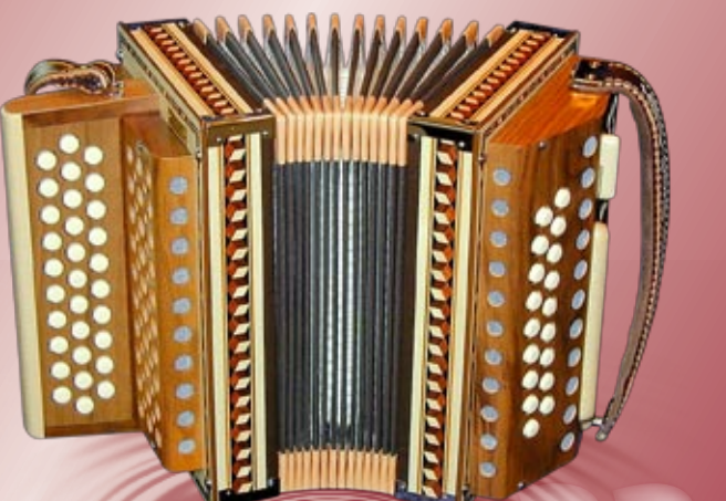
Typ 80 N - 4 Rudolf Reist sen. 2- oder 3-chörig