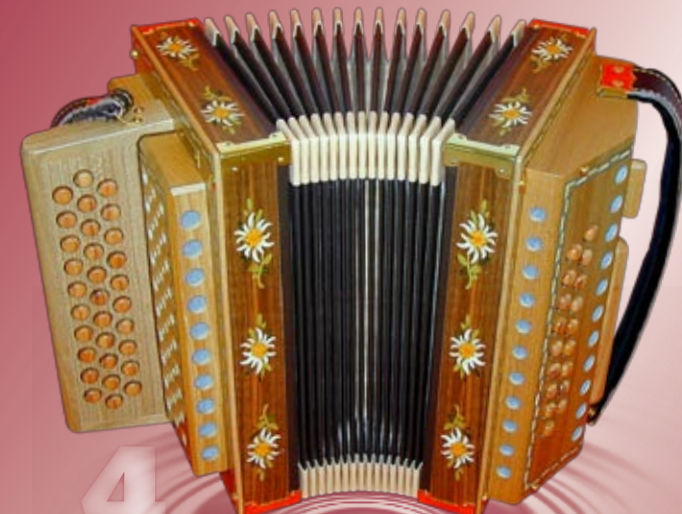
Typ Ulme - EMNN 2- oder 3-chörig