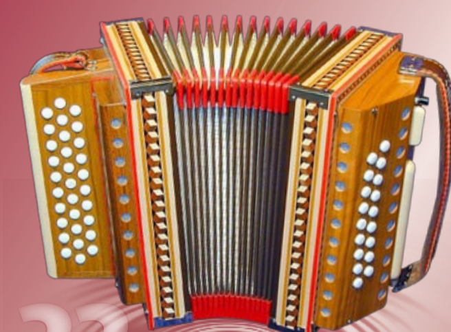
Typ 80 N - 4 Rudolf Reist sen. (Rote Eckenleder) 2- oder 3-chörig