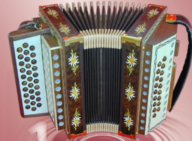
Typ 91A - EMNM 2- oder 3-chörig

Mauer 590, CH-3454 SUMISWALD Telefon: 034 / 437 18 00