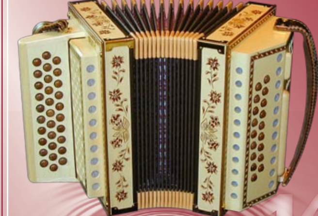
Typ 90 A - G Handgeschnitzte Edelweiss / Enzian in Ahornholz 2- oder 3-chörig