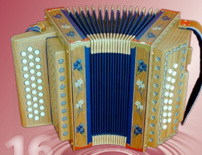
Typ 87 K - EE Edelweiss / Enzian Intarsien 2- oder 3-chörig