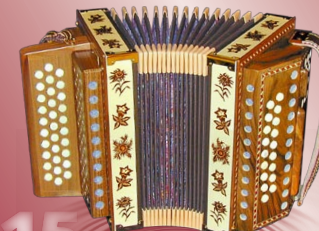
Typ 88 N - Gebrannt Gebrannte Edelweiss / Enzian in Ahornholz 2- oder 3-chörig