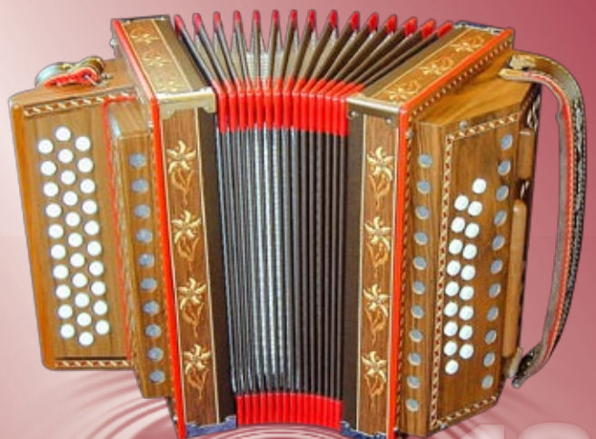
Typ 88 N - EN Edelweiss Intarsien 2- oder 3-chörig