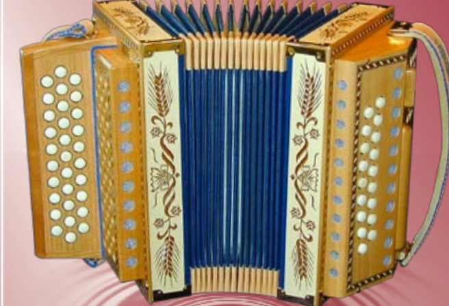
Typ 87 K - G (Blauer Balg) Handgeschnitzte Aehren in Ahornholz 2- oder 3-chörig